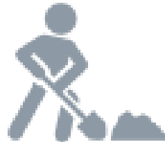
Edificación y obra civil