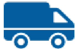
Sector Transporte y logística